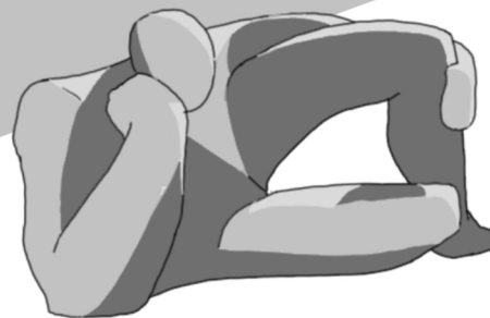
MLÁDÍ - LADISLAV MARTÍNEK

TATO SOCHA ZOBRAZUJE POKLIDNÝ ODPOČINEK DVOU SOCH, KTERÉ SE NACHÁZÍ V PARKU NA SÍDLIŠTI.